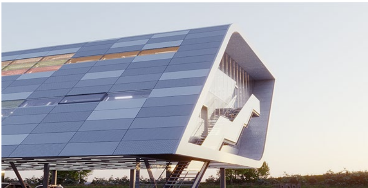
Modélisations : BORA

Téléchargement des images : https://www.bora.com/fr/fr/entreprise/presse/