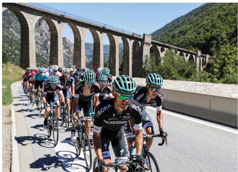
Das Team BORA – hansgrohe beeindruckt nicht nur deutschlandweit, auch international zeigt es sich dynamisch, leistungsstark und nahbar.