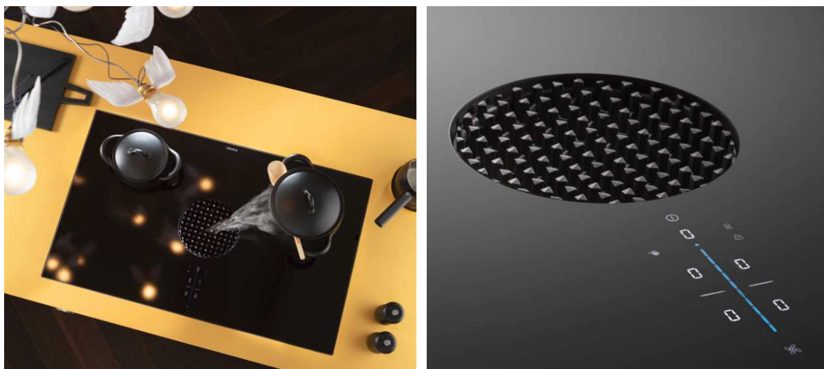
BORA X Pure: L'ultimo sviluppo del prodotto in un design distintivo

Raubling. BORA Lüftungstechnik GmbH, azienda produttrice di innovativi aspiratori per piano cottura, presenta una nuova linea di prodotti: la nuova BORA X Pure che completa, come sistema a induzione "FULL", la famiglia BORA Pure degli apparecchi compatti convince non solo dal punto di vista estetico con un design di grande impatto della bocchetta di entrata e un pannello di comando di colore diverso, ma anche per le sue funzionalità aggiuntive che rendono il processo di cottura ancora più semplice.