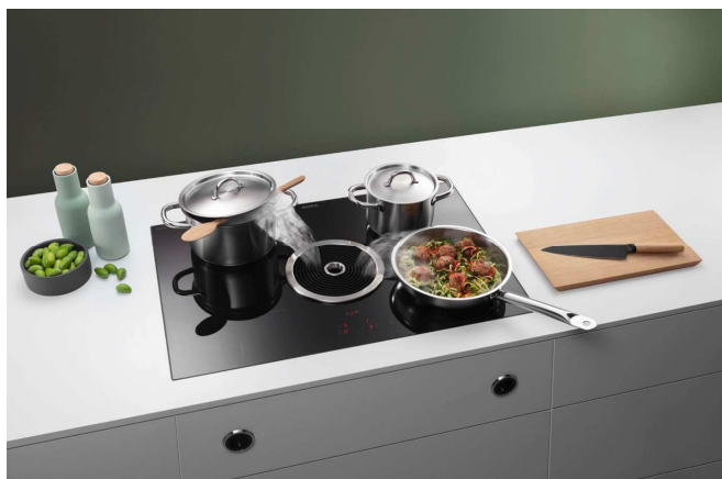
BORA Basic: aspiratore per piano cottura come sistema compatto

Due ventilatori all'interno del piano cottura funzionano parallelamente e silenziosamente. BORA Basic può essere montato senza problemi in ogni cucina ed è subito pronto all'uso, attraente dal punto di vista estetico e facile da usare. Le parti mobili dell'aspiratore per piano cottura sono facilmente smontabili, consentendo una rapida e facile pulizia. L'ugello di afflusso e il filtro per i grassi in acciaio inox sono persino lavabili in lavastoviglie. Un indicatore nel display tattile centrale indica quando è giunto il momento di sostituire il filtro al carbone attivo nel sistema filtrante.