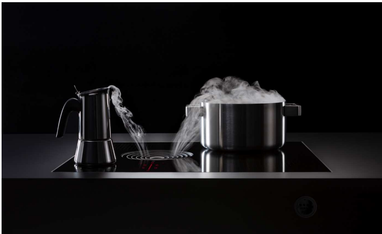
BORA S Pure: de nieuwste compacte oplossing van het krachtige inductiesysteem.

Raubling. BORA Lüftungstechnik GmbH, fabrikant van innovatieve kookveldafzuigingen, introduceert een nieuwe oplossing voor in de keuken: de BORA S Pure is de jongste telg in de BORA Pure-familie van compacte afzuigsystemen. Hij is trouw aan het motto 'form follows function' en overtuigt niet alleen door zijn elegante design, maar ook door de topprestaties en een optimaal gebruik van het kookveld.