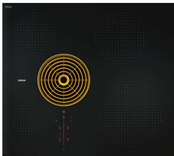
BORA S Pure in altre varianti di colore.