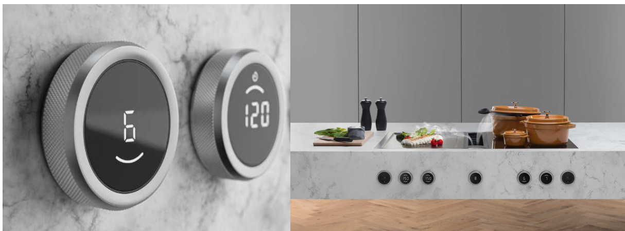
BORA Professional 3.0: Il non plus ultra per la tua cucina