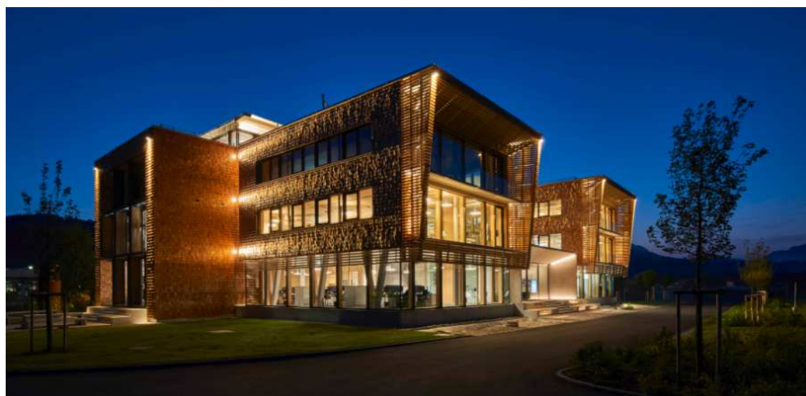
Nouveaux quartiers de BORA à Niederndorf