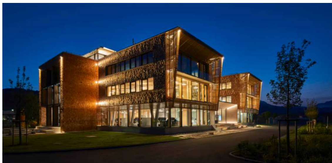
Nuevo edificio de BORA en Niederndorf