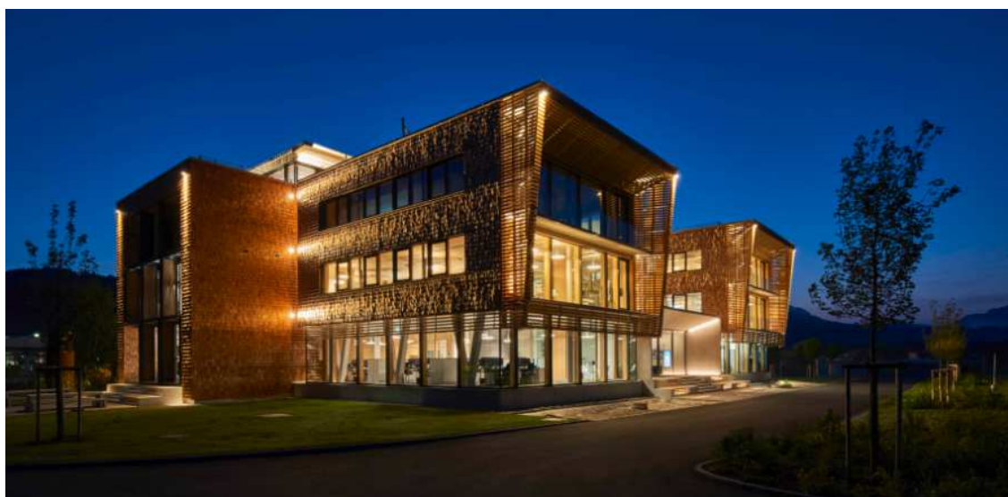
BORA Neubau am Standort Niederndorf